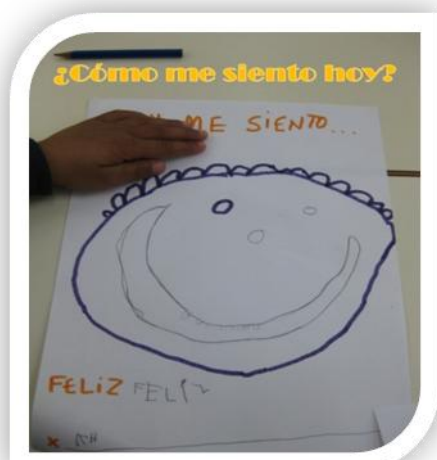
La autoregulación 1

La autorregulación , en cuanto a ella expresar que la intencionalidad pedagógica del docente en este eje básico se concreta en ayudar a los pequeños a ajustar sus respuestas emocionales a cada situación y estado de ánimo, tanto para su propio bienestar como el de su entorno. Los profesionales de este ciclo debemos tener siempre presente las características psicoevolutivas propias del 2º Ciclo,- egocentrismo, centración, irreversibilidad, etc.- para llevar a cabo las actividades. Así como las diferencias marcadas que existen dentro del propio ciclo. En 3 años comenzaremos a familiarizarlos con dos emociones básicas como la alegría-tristeza-enfado, a través de imágenes, de la expresión corporal, cuentos, canciones. De esta manera progresiva iremos en 4 y 5 años incorporando el reconocimiento de nuevas emociones como miedo, sorpresa, etc. dependiendo, claro está, del grupo-clase con el cual trabajamos.