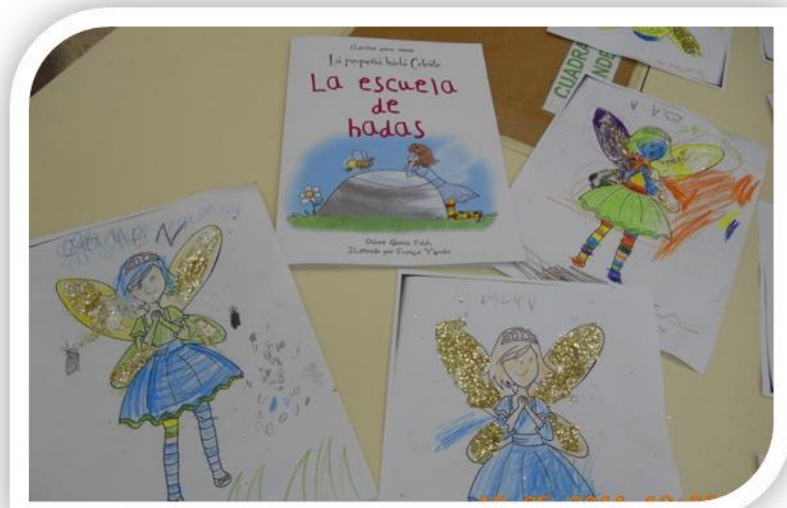
Cuento: La escuela de las hadas 1

El cuento es un recurso de significativo valor para el reconocimiento de las emociones de los demás y la empatía. Contamos para ello con una interesante lista de autores que abordan las emociones mediante cuentos en los cuales los personajes se relacionan con diferentes estados de ánimo. Ejemplo de ello es el texto “La escuela de hadas” (Cuentos para crecer) de Dolors Garcia Folch que nos invita a descubrir qué siente el Hada Celeste (personaje del cuento) y como resuelve la situación.